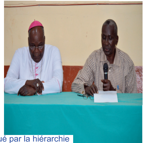
L'engagement professionnel du doyen inspire les plus jeunes et a été salué par la hiérarchie