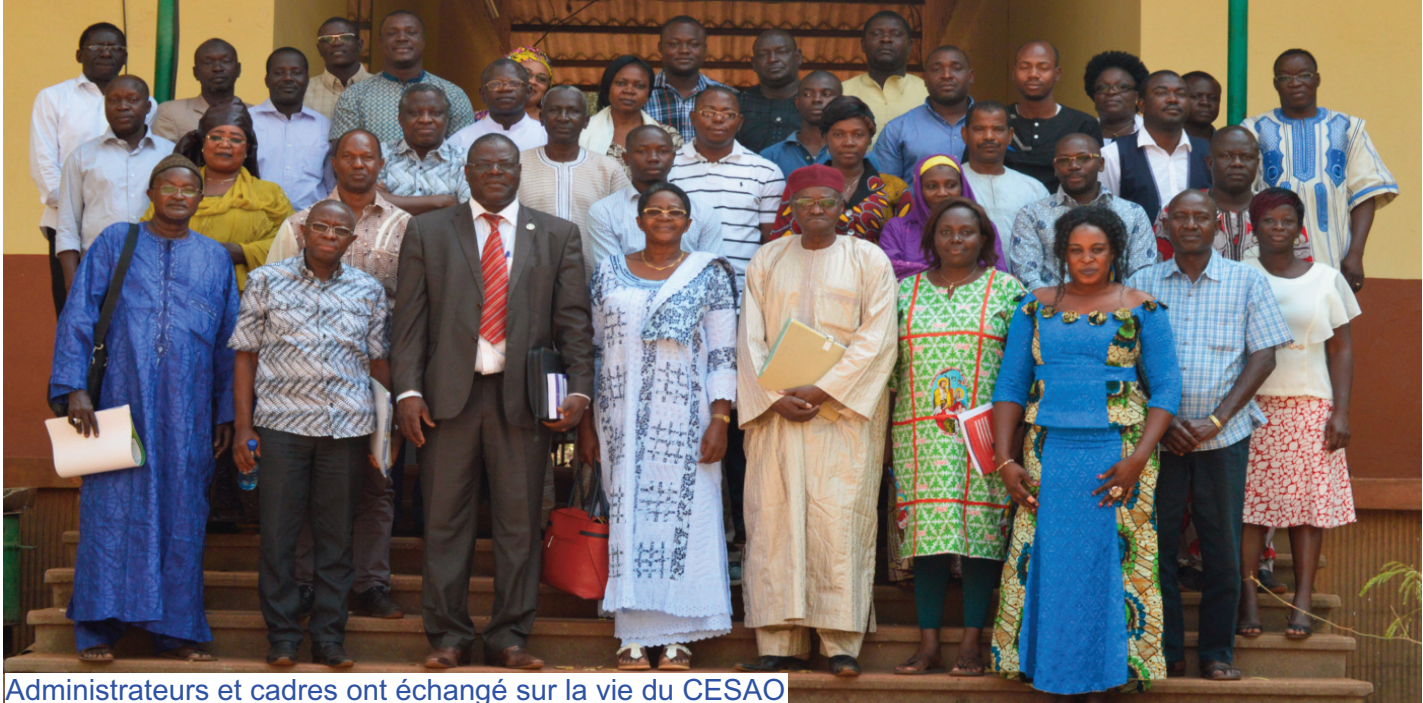
Administrateurs et cadres ont échangé sur la vie du CESAO

Le Pôle régional Burkina a accueilli du 4 au 7 janvier 2017 la session pédagogique annuelle 2016 du CESAO. Comme tous les ans, elle a réuni les cadres du CESAO-AI et des administrateurs de l'institution venus du Niger, du Togo, du Sénégal, du Bénin et du Burkina Faso.