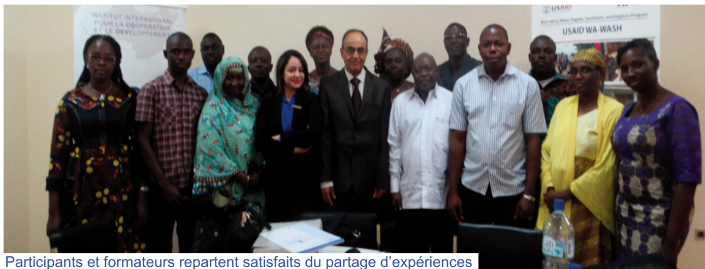
Participants et formateurs repartent satisfaits du partage d'expériences

Renforcer les capacités des administrateurs et des financiers de CESAO/AI sur des questions de gestion comptable et financière. C'est l'objectif de cette formation, première d'une série, qui s'est tenue du 20 au 24 février 2017 à Ouagadougou